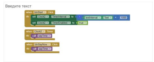
Кнопки главного экрана